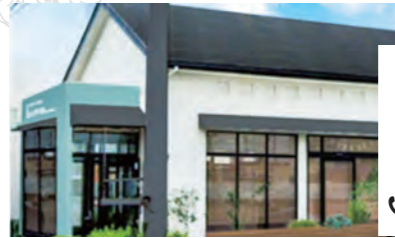
bona. 前橋店 群馬県前橋市 関根町1-11-4 ☎027-289-9913