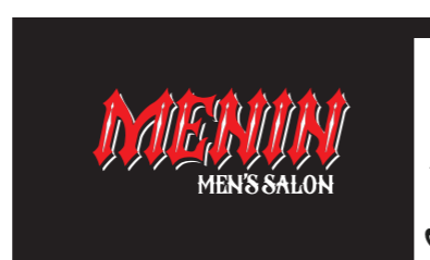
MENIN 神奈川県相模原市 南区相模大野3-17-15 東邦ビル相模大野1F ☎042-705-2334