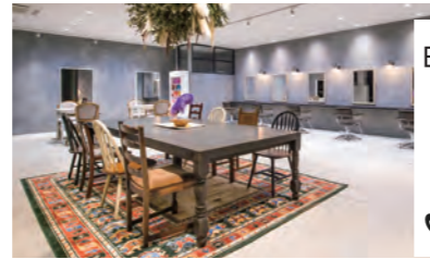
ESCAPE to bona. 高崎店 群馬県高崎市 小八木町2037-2 ☎027-387-0897