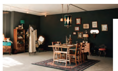
feter BRIDAL 伊勢崎 群馬県高崎市 小八木町2037-2