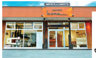
bona. 伊勢崎店 群馬県伊勢崎市 連取本町24-19 ☎0270-22-5622